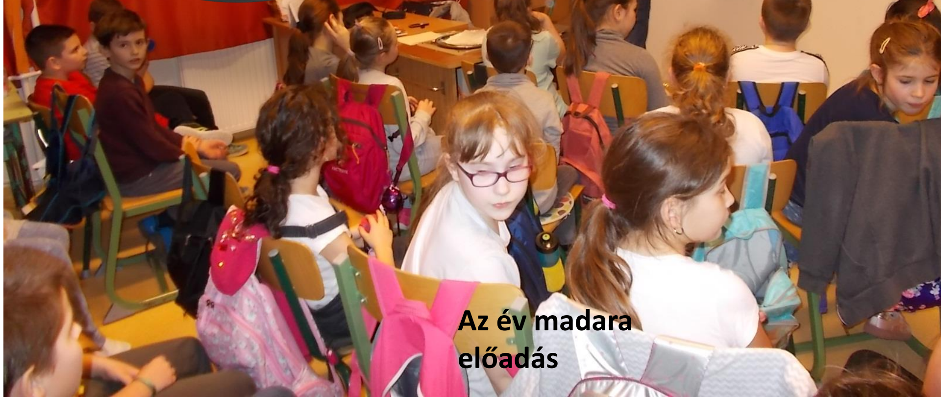
Az év madara előadás