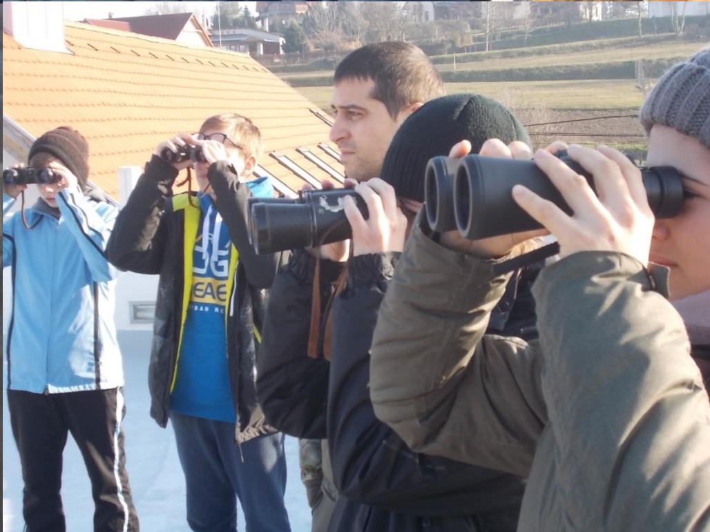
Két terepi helyszín: a Béka-tavak és az alsómocsoládi halastavak voltak.