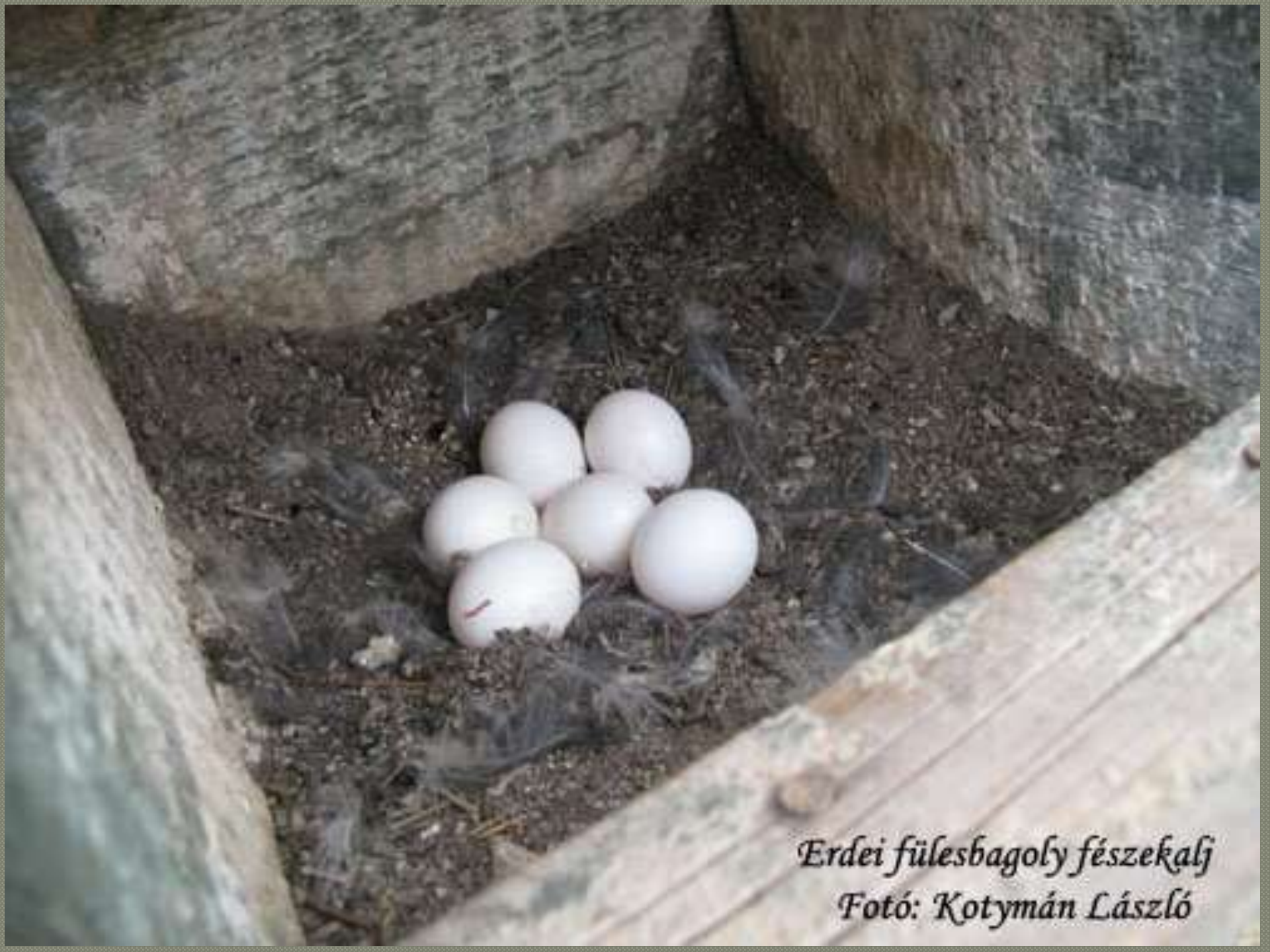
Erdei fülesbagoly fészekalj