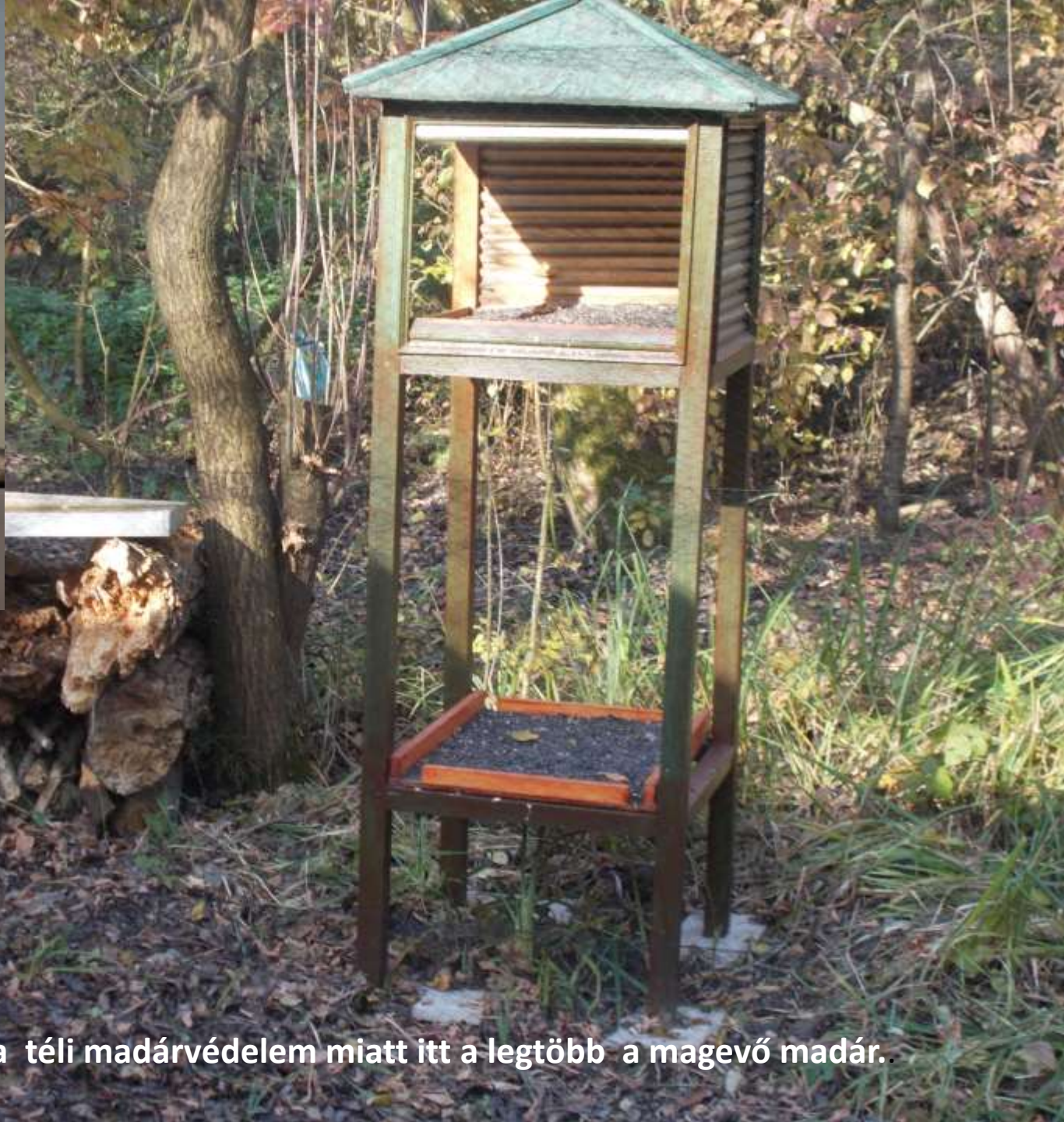
Konda völgye - a téli madárvédelem miatt itt a legtöbb a magevő madár.