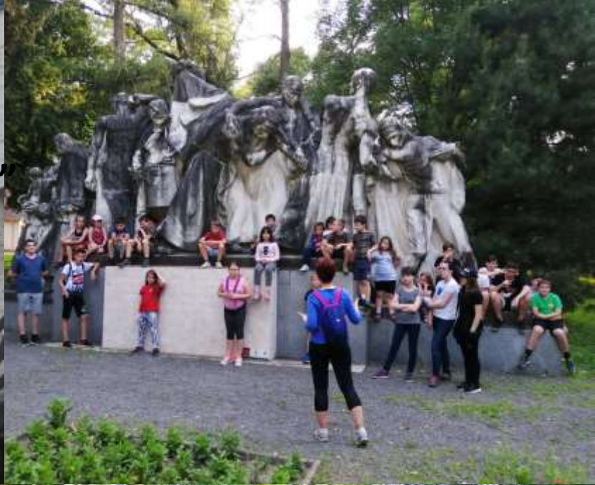
Szigeterdő (botanikai és zoológiai értékei, Lakótorony, és a 48-as szoborcsoport)