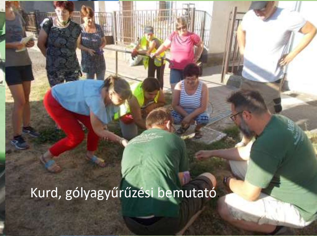
Kurd, gólyagyűrűzési bemutató