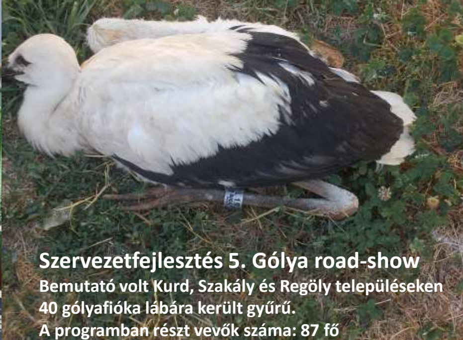
Szervezettefejlesztés 5. Gólya road-show Bemutató volt Kurd, Szakály és Regöly településeken 40 gólyafióka lábára került gyűrű. A programban részt vevők száma: 87 fő