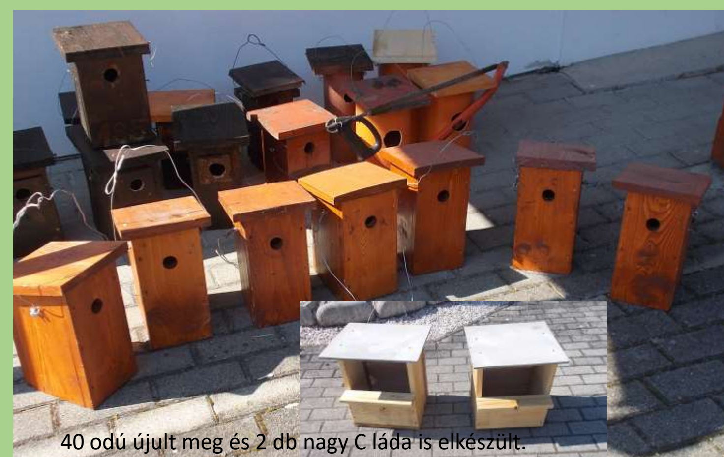
40 odú újult meg és 2 db nagy C láda is elkészült.