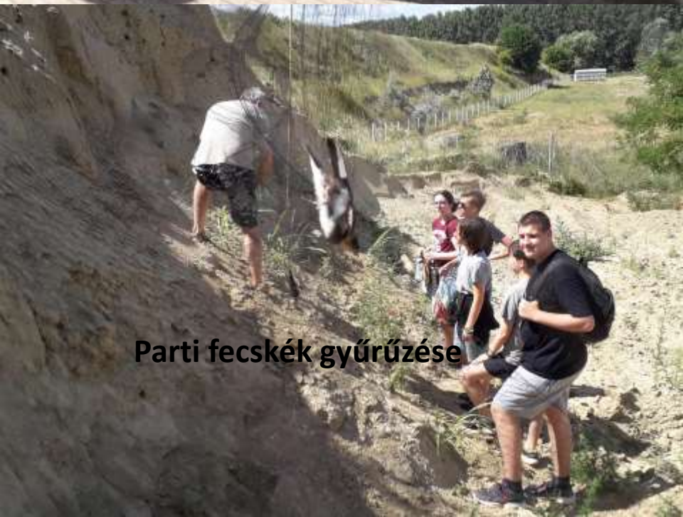
Parti fecskék gyűrzése