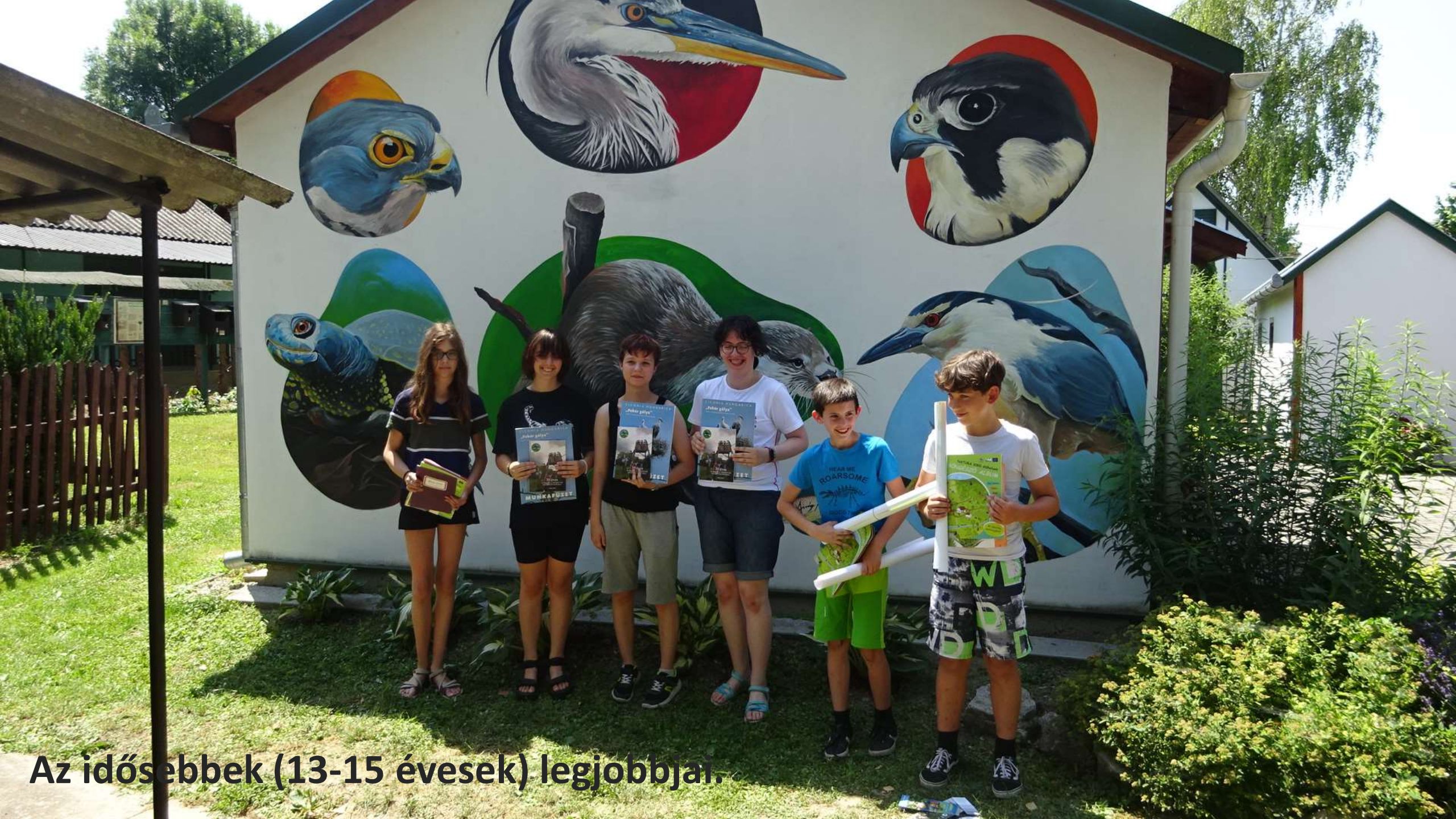
Az idősebbek (13-15 évesek) legjobbjai.