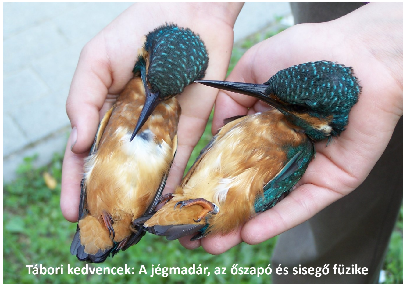
Tábori kedvencek: A jégmadár, az őszapó és sisegő fűzike