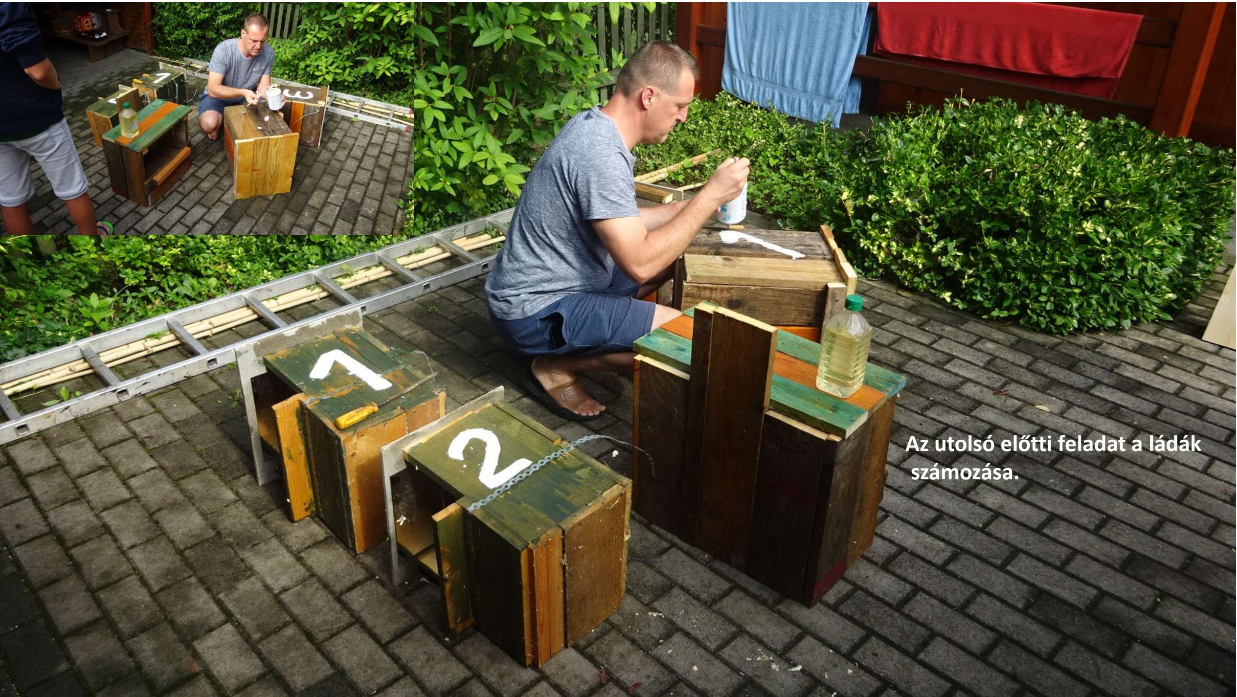
Az utolsó előtti feladat a ládák számozása.