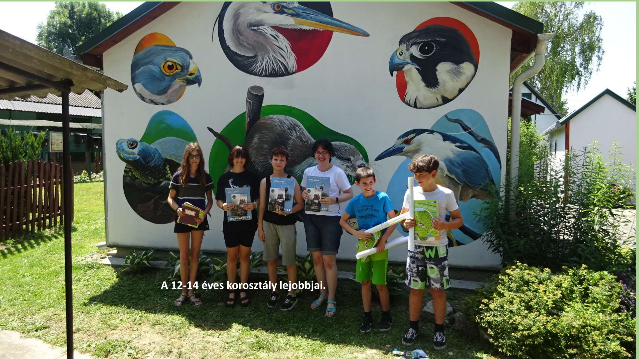
A 12-14 éves korosztály lejobbjai.