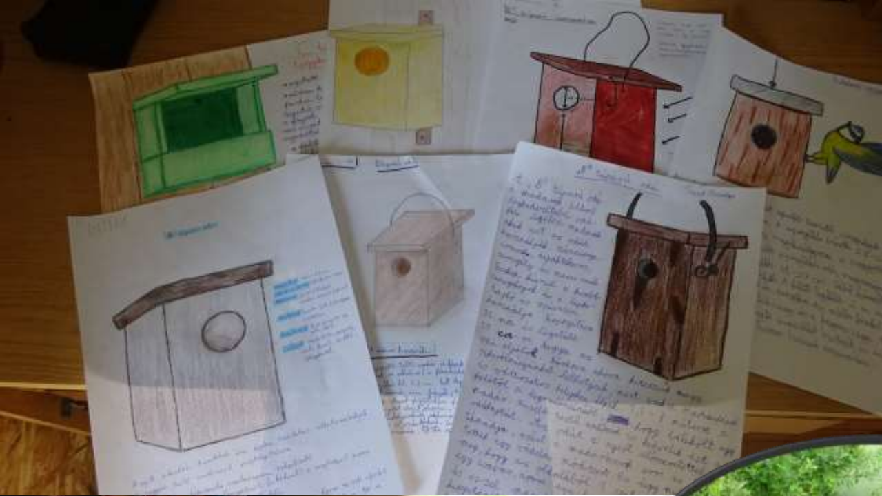
A verseny 3. helyezett csapata