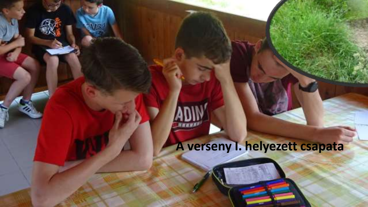
A verseny I. helyezett csapata